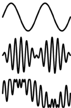
図1 これらの波の周波数はいくつ？

周波数とは「電気振動などの現象が1秒間あたりに繰り返される回数（Wikipediaより）」である。これはほとんどの読者が理解していると思われるが、話はそれほど単純ではない。例えば、図1に示した3つの波について、波の始点から終点までを1秒間としたとき、各々の波の周波数はいくつだろうか？