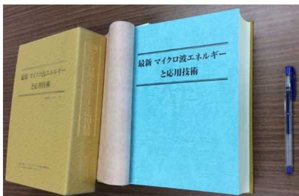
図2. ハンドブックの外観

以上の主旨の下、2014年11月に産業技術サービスセンターより、「最新 マイクロ波エネルギーと応用技術」という名称のハンドブックが図2のような装丁で発刊された。B5版、950頁で、内容は3)に示す構成となっており、JEMEA会員を始め多くの研究者や企業から購入され、好評を博している。